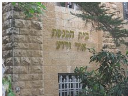
בית הכנסת אור זרוע